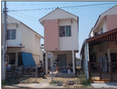
ลักษณะบ้านพักอาศัย