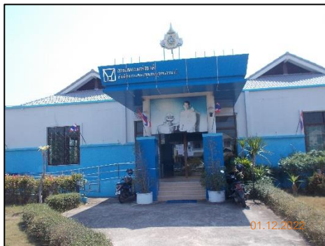
ศูนย์ชุมชน