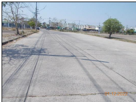
พื้นที่ถนน-ทางเท้า