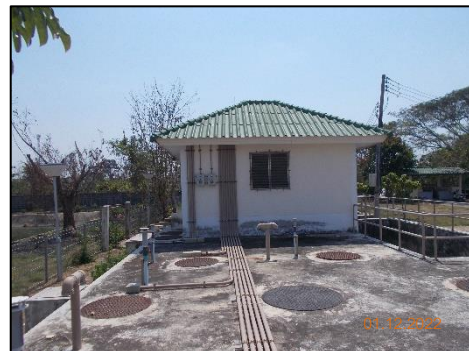
พื้นที่บ่อบำบัดน้ำเสีย