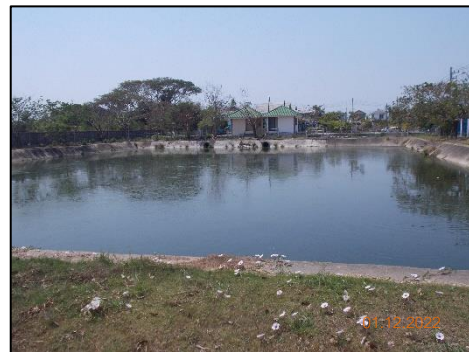
บ่อหนองน้ำ