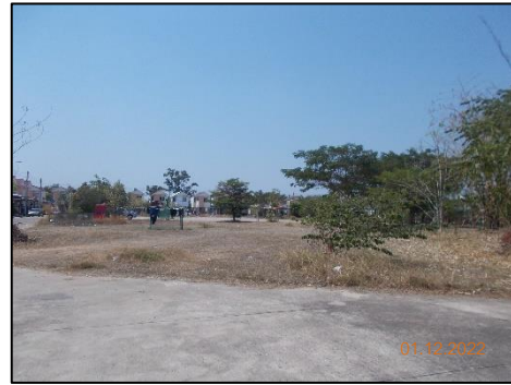
พื้นที่สวนสาธารณะ